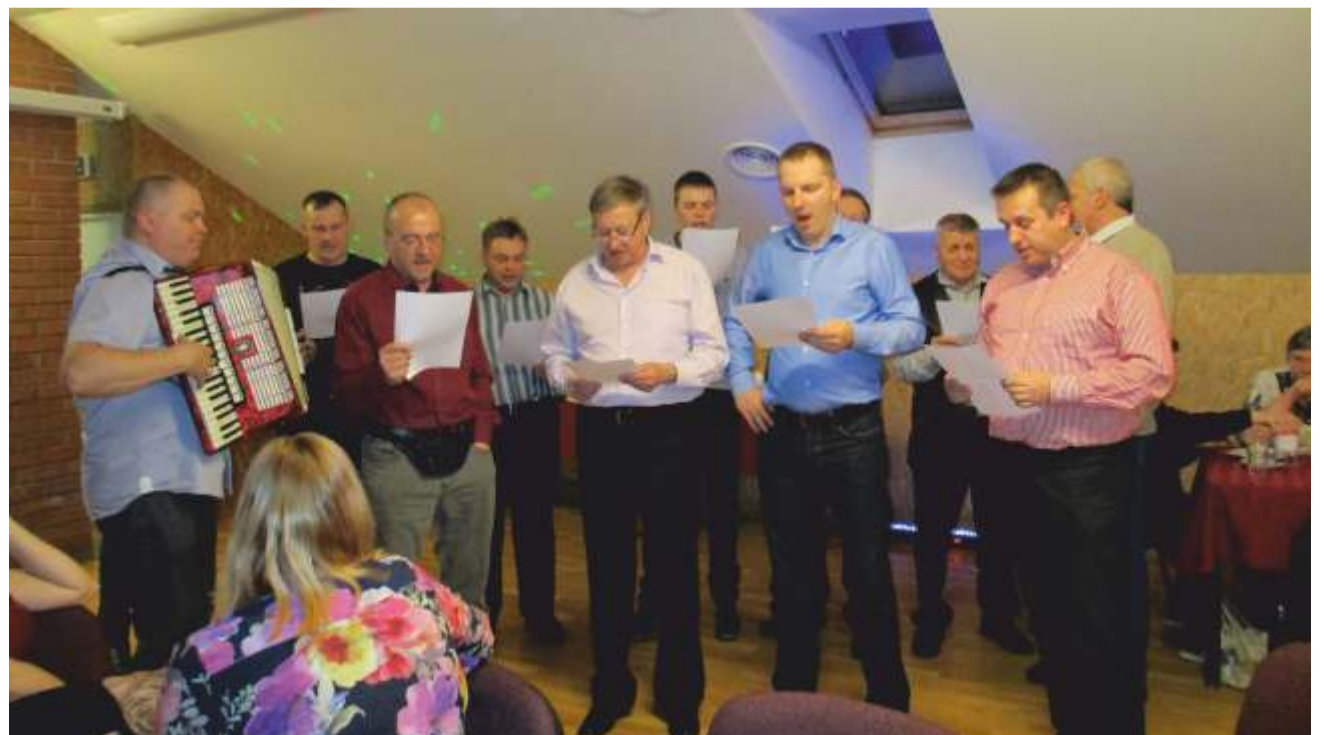
Mehed naistele laulmas.