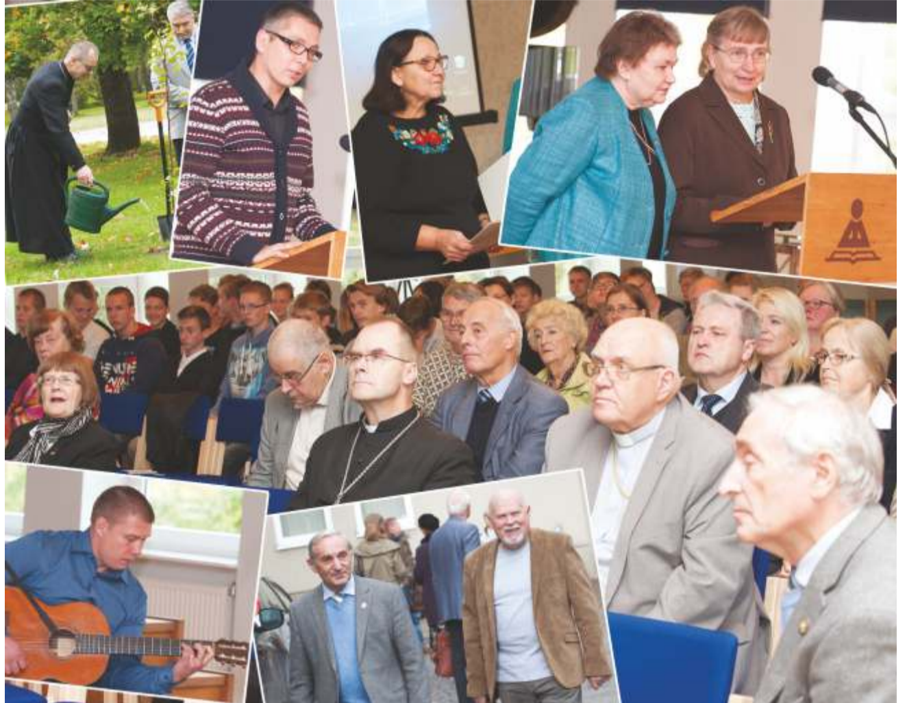
Hetki konverentsi avamiselt.