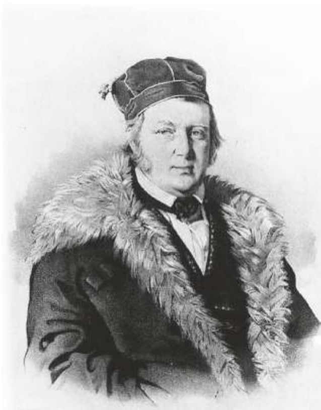
F.G.W. Struve (1844)

2016. aastal möödub 200 aastat ajast, mil kaks eestimaalast – astronoom F. G. W. Struve (1793-1864) ja geodeet C. F. Tenner (1783- 1859) alustasid üksteisest sõltumatult triangulatsiooniahela mõõdistamist. Struvel ajendas ligi 40 aastat kestnud mõõtmistööd ette võtma soov kindlaks määrata täpsemalt maakera kuju ja suurus. Töö toimus 1816 – 1855. 1828. aastal sõlmitud kokkuleppe alusel ühendati Struve ja Tenneri kaaremõõtmised, kus Tennerile jäi geodeetiline ja Struvele astronoomiline osa. Triangulatsiooniahela loomisest oli väga praktiline väljund – see oli aluseks topograafiliste kaartide loomisele. Struve teenete tunnustamiseks Maa meridiaani mõõtmisel anti