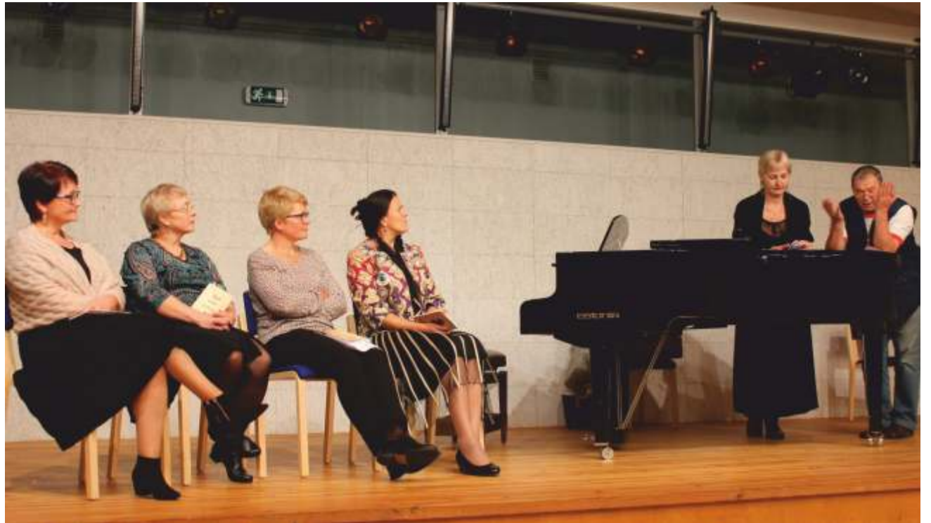
Toila kirjandusringi esinejad.