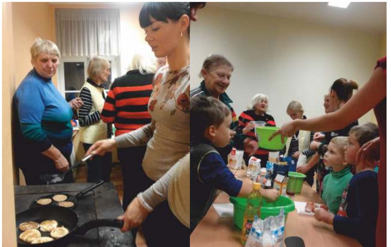
Külakoja kook sai pannkoogisõpradest täis.