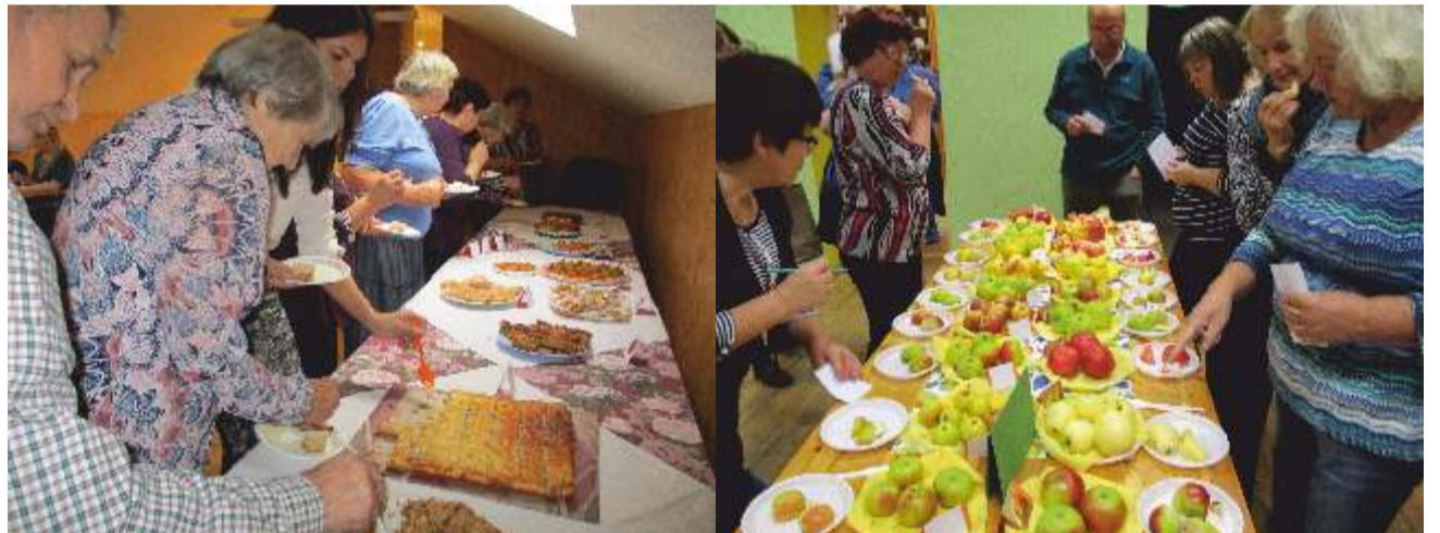
Maitsta sai nii õunu kui õunakooke.