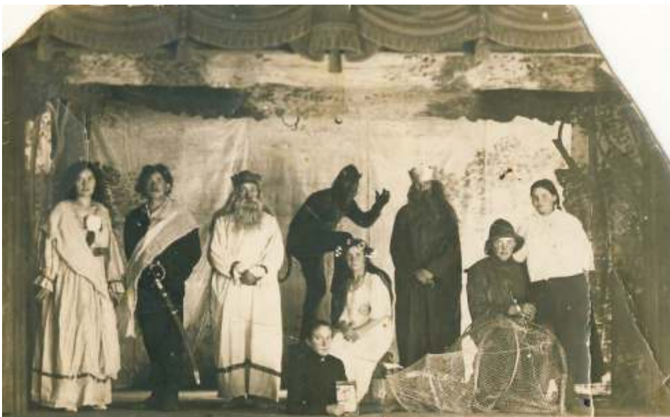
Haljala tuletõrjeseltsi näiteringi etendus. SA Virumaa Muuseumid