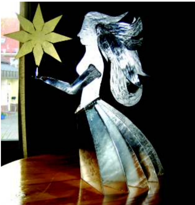
Imeline kingitus meie vallale saksa sõpradelt.

del, tulgu tuld või tõrva, toimub seal kontsert, korraldajaks vald. Kuulajad on kohal ja algus peab ka täpne olema - 19.30! Meie eestlannast tõlk Kersti, kes pärit Tapalt, rääkis, et iga korralik sakslane unistab suvel olla mere ääres, üürida seal mõnus korvtool ja süüa kalasaia.