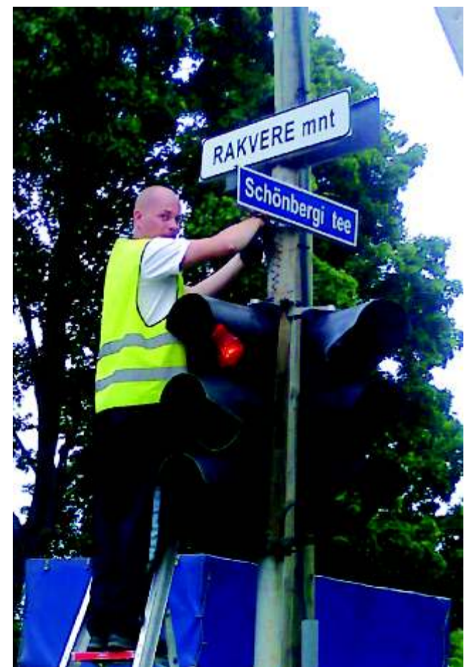
Nüüd on ametlikult Haljalas olemas tänav Schönbergi valla auks.

See on hea nii meie valdadele kui ka Euroopale, nii et kõike head meie sõpruslepingutele ja kõike head Euroopale!