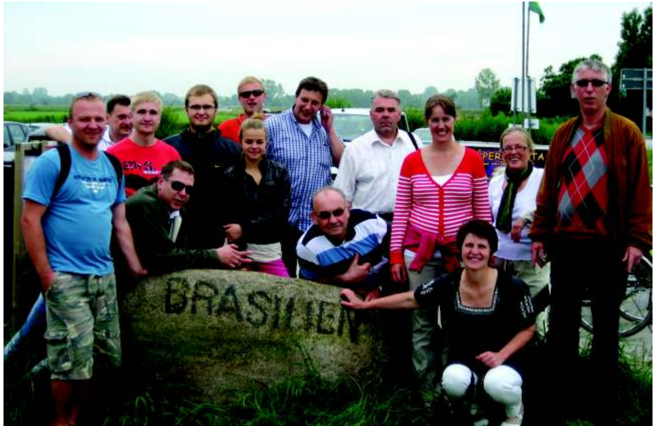
Vastuvõtuprogrammist ei puudunud ka tervist edendav osa, toimus rattamatk Brasiilia rannast California randa. Pildil on koos matkasellid Schönbergist, Rootsi sõprusvallast Älvdalenist ja Haljalast.

Küllap arvab lugeja, et oli kaks pikka päeva pidutsemist. Ei - pigem ikka tööd, või kui, siis töö ja lõbu käsikäes. Vallajuhtid arutasid edasisi koostöövõimalusi, muusikud häälestasid pille, harjutasid. Schönberg oli ju lausa Haljala muusikapäevad välja kuulutanud! See kohustas ja eslots vaat et kohutas ka. Ans. Ansambel oli täiskoosseisuga, aga meie kolmeliikmelisel rahvamuusikute esindusel tuli sama panus n.ö. tulle panna. Ära tegime! - meid kuulati-vaadati hoolega. Pisemale publikule läks vägagi korda, kuidas laulab Eestimaal kass või kukk, kuulati erinevaid pille ja ringtantsu saime kaasa nii suuri kui väikseid. Ega vabas õhus on päris raske end kuulama panna - esimene kontsert toimus nimelt rannapromenaadil. Schönbergi vald piirneb põhjast väga ilusa mererannaga ja suvitusteenuse pakkumine selles piirkonnas on oluline tööallikas. Olid nemadki väga kurvad, et see suvi on nii külm ja vihmane olnud. Aga igal ree-