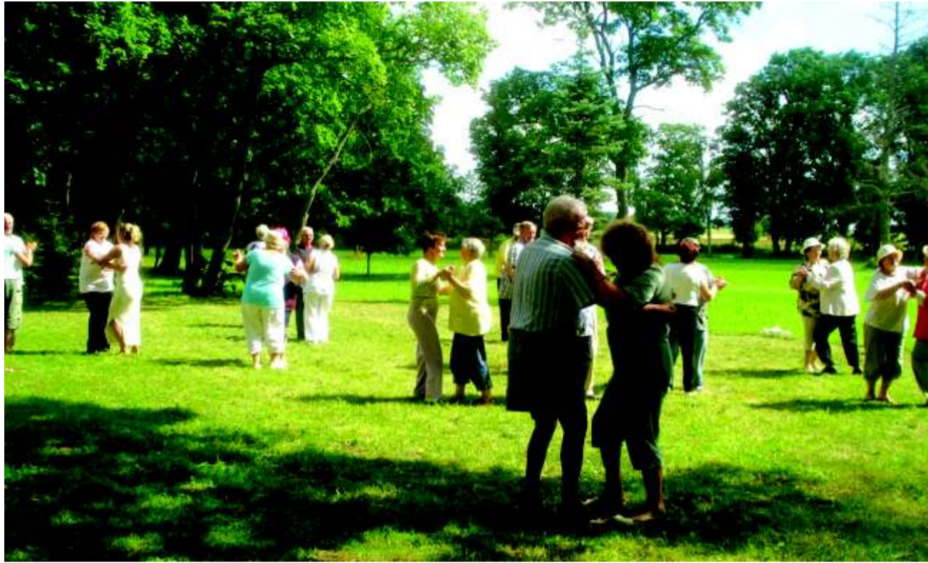
Ilus ilm ja muusika kutsus kõiki tantsule