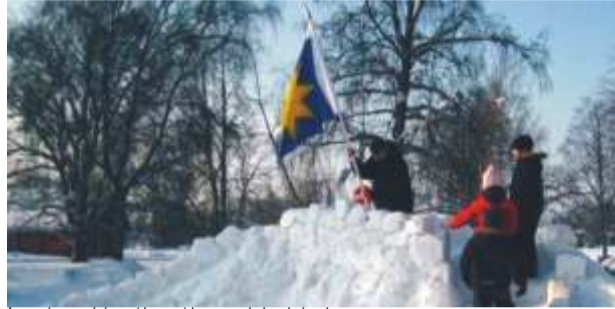
Igas korralikus (lume)linnas lehvib ka lipp