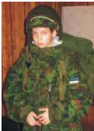
Noorkotkas Pärt kaitseliidu varustuses, milles liikumine niisama kerge ei olegi.

Kui tahad meiega ühineda, siis helista telefonil 555 64032.