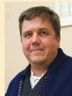
Rene Treial Vihula vallavanem