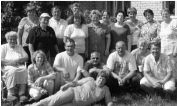
10. juulil 2010 kohtusid endise Keskuse (Idavere) farmi kolleegid piknikul ja meenutasid ühiseid tööaegu 1990. aastatel

Oh seda karjarahva elu pakkus see vast melu hommikul kui kires kukk silmist kadus unetukk