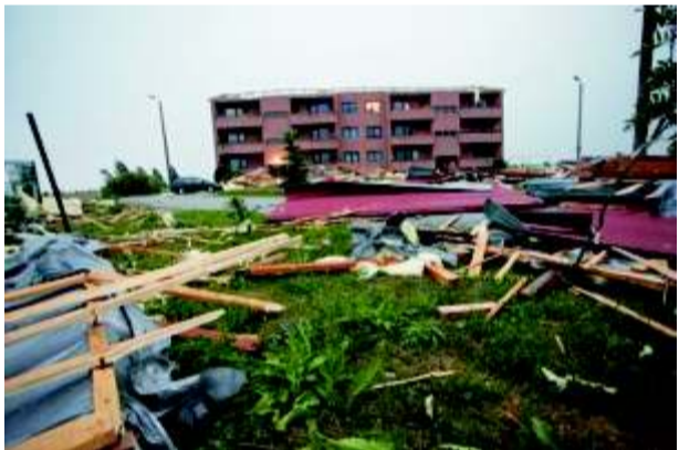
Vaade Põllu tänava majale peale tormi