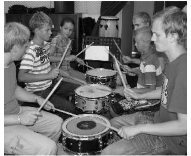
Kolm trummi ja kuus pillimeest - kas kokkuvõtteid või hoopis osavus?