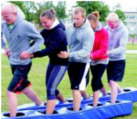
Nii nägi välja suusatamine hiiglaste suuskadel

Täpsem ülevaade ja võistluste kokkuvõtted ilmuvad juba järgmises lehes.