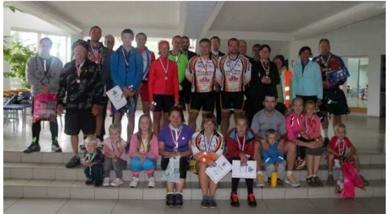
Rattaralli osavõtjad pärast autasustamist.