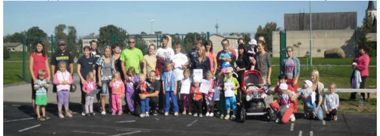
Põnnide 3-võistluse osavõtjad pärast autasustamist.