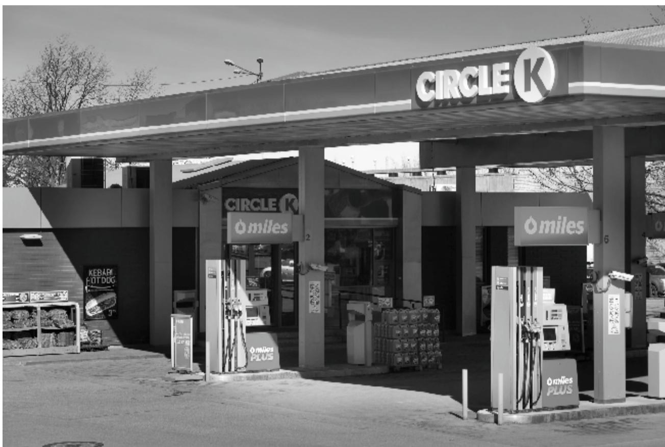
Uuenenud Circle K teenindusjaam

Eesti suurima turuosaga mootorikütuste jaemüüja Circle K Eesti AS omab ja opereerib Statoili ja Circle K kaubamärkide all töötavat 56 täisteenindus- ja 19 automaatjaama ning üht mugavuspoodi. Ettevõttes töötab ligi 700 inimest, neist enamus teenindusjaamades.