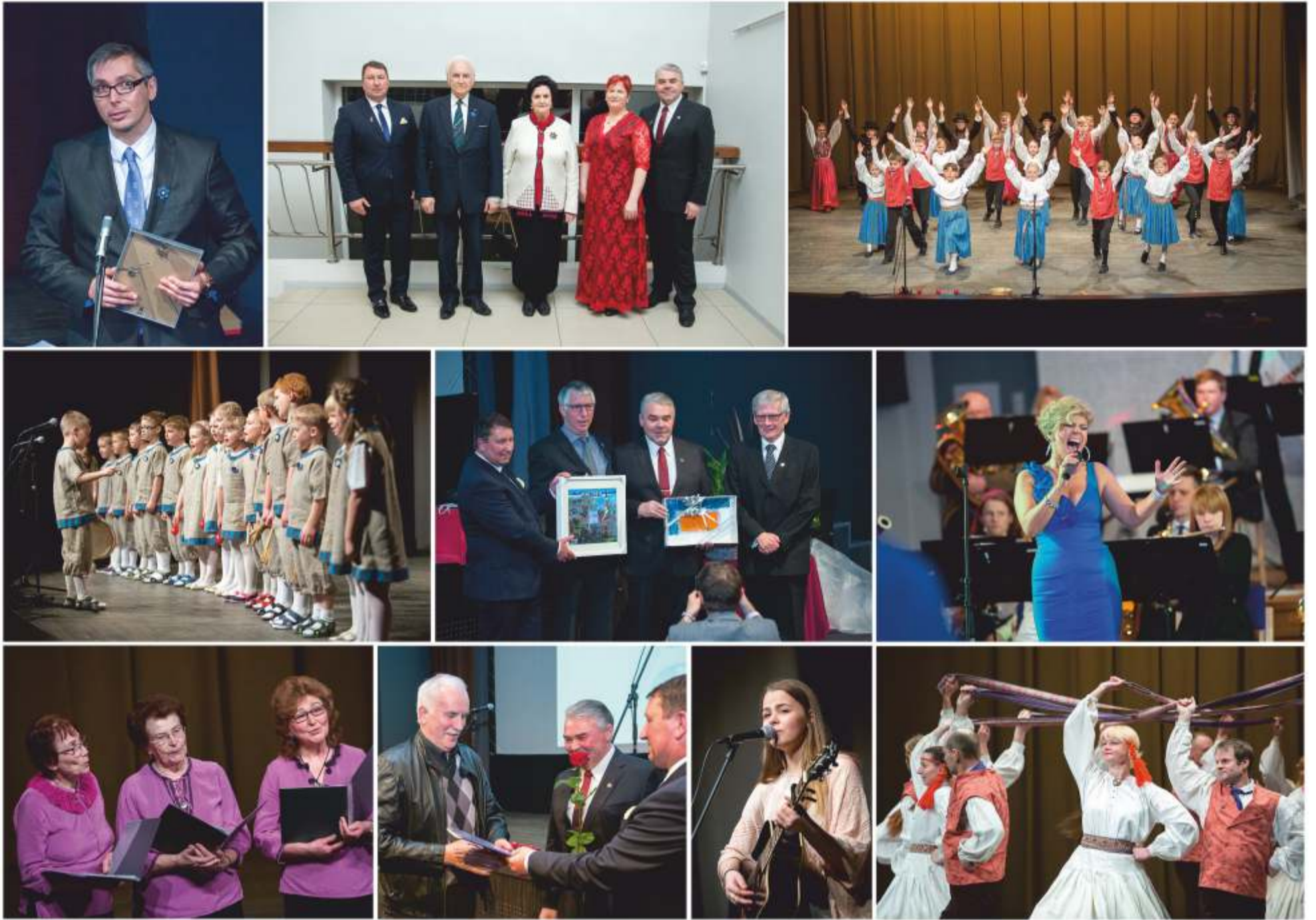
Ain Liiva fotod