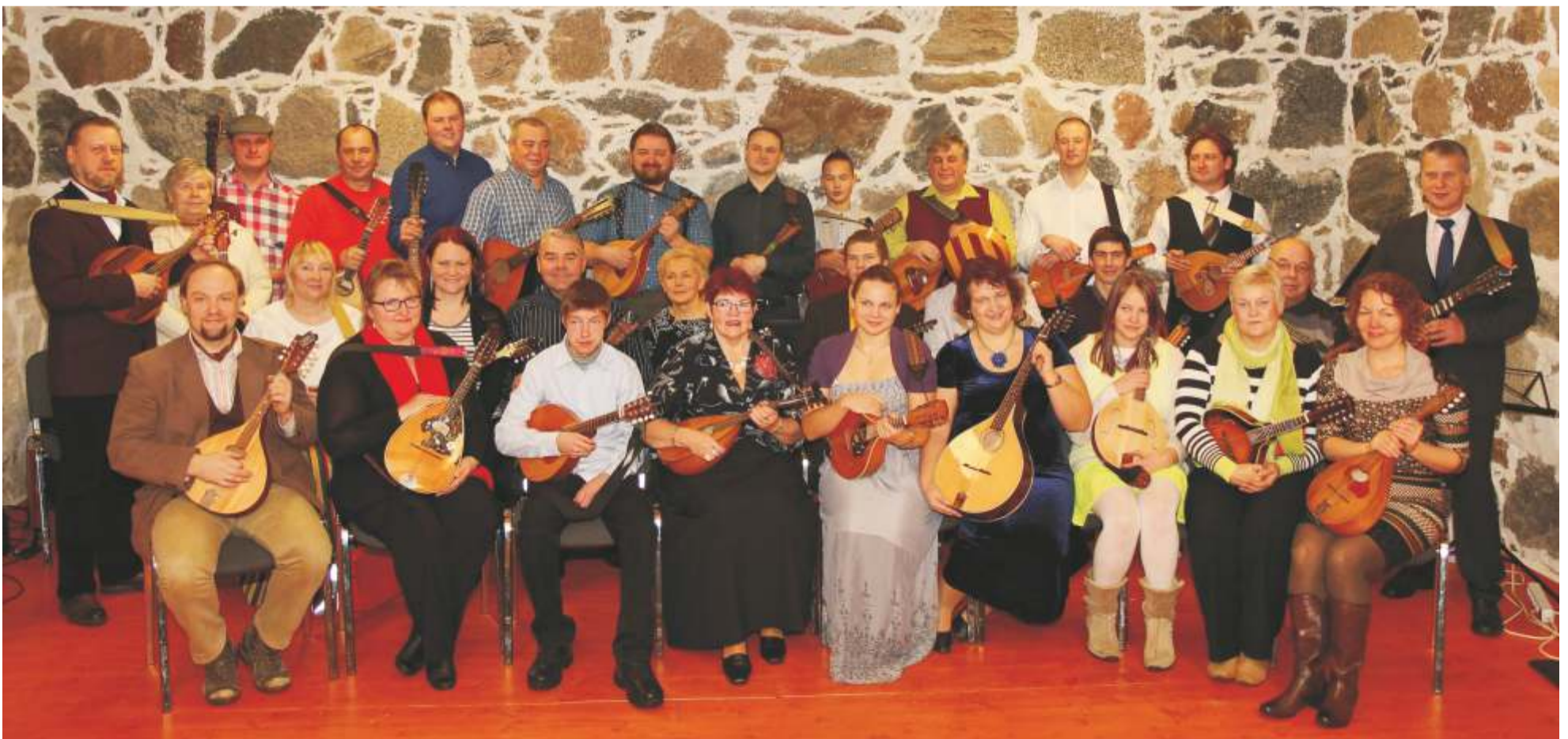
Uhtna Mandoliinid esinemas Miila seltsimajas 2014. aasta jõulude aegu.