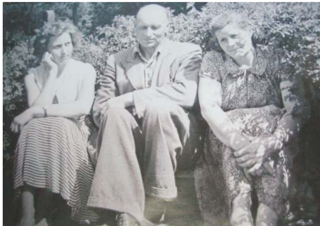
Isa ja emaga Haljala surnuaias.