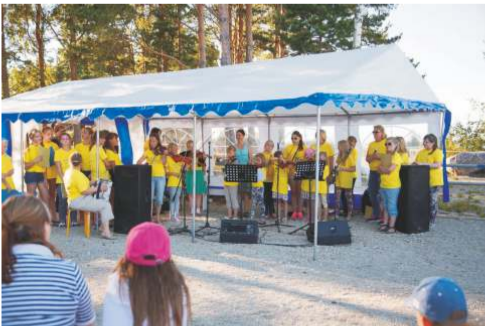
Lisaks laulule kõlasid ka viiulite ja flöotide helid.